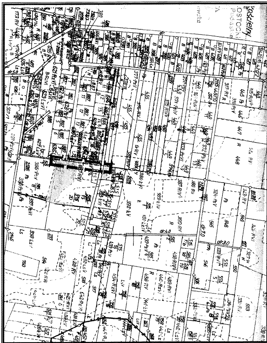
obszar planistyczny Lewickie linia gazowa