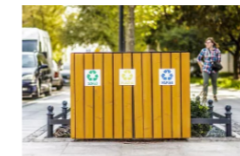
KOSZ DO SEGREGACJI